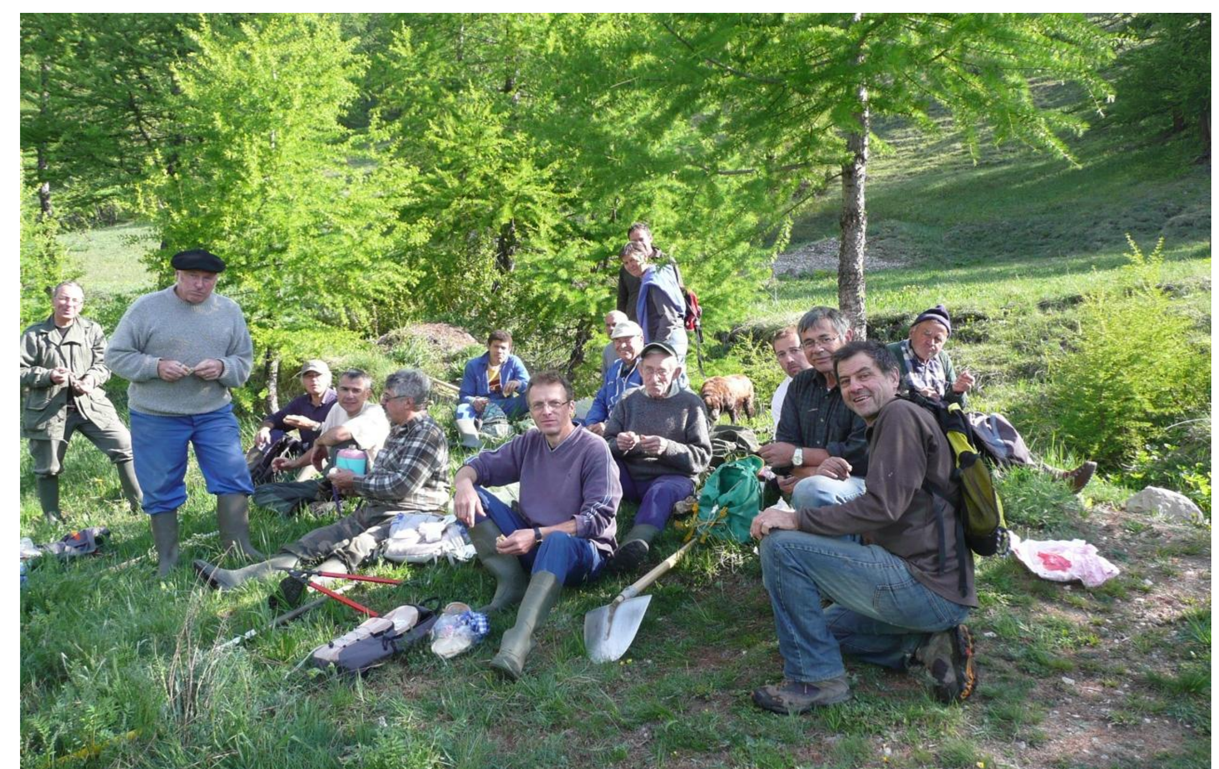
Corvée festive – Puy St André