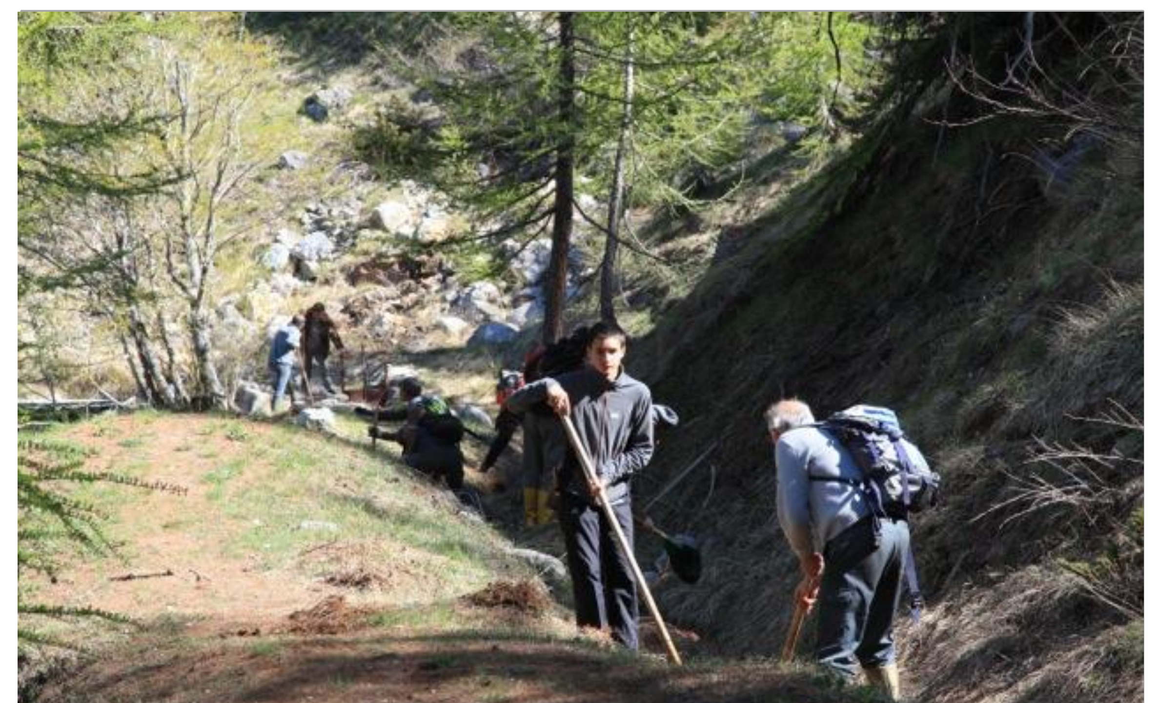
Remise en état d'un canal – Puy Saint André